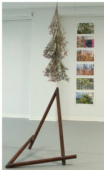
3. Anne-Élisabeth AZRA, Habitants des lieux communs , série de photographies numériques, 30 × 42 cm par image, 2023