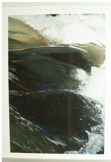
11. Alexis DUPLOUY, Déferlement naturel , photographie numérique, 225 × 106 cm, 2023