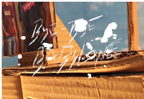
9. Aki DAUTHEVILLE, Bye bye Babylone , animation traditionnelle sur photographie, 2 mn 20, 2022