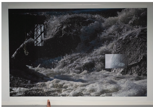
12. Alexis DUPLOUY, Déferlement structurel , montage, photographie numérique, 225 × 400 cm, 2023