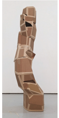
5. Anne-Élisabeth AZRA, Totem – tu offres protection et chaleur , sculpture en carton, 190 × 50 × 50 cm, 2024