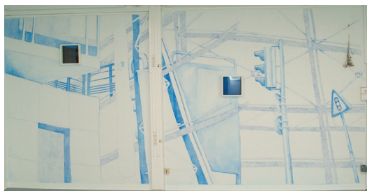
1. Anne-Élisabeth AZRA, Au rythme de l'eau , fresque au pastel sec, photographie numérique et cadres, 200 × 400 cm, 2024

Autour de celle-ci gravitent d'autres productions mettant en lumière le regard sensible et l'interprétation de chacun·e sur la ville organique. Elles prennent corps à travers la photo, le dessin, la sculpture et la vidéo, et ont pour sujet formel autant la nature, que les structures métalliques et les tags. C'est l'ensemble qui réalise la ville, comme un tout qui se répond.