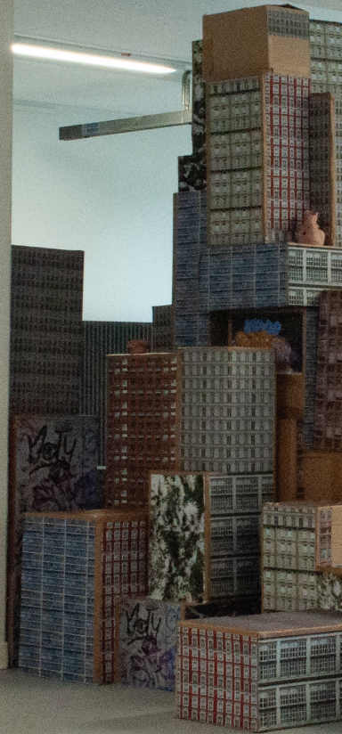
8. Production collective, Ville organique , installation carton, photographies numériques et céramiques, dimensions variables, 2024