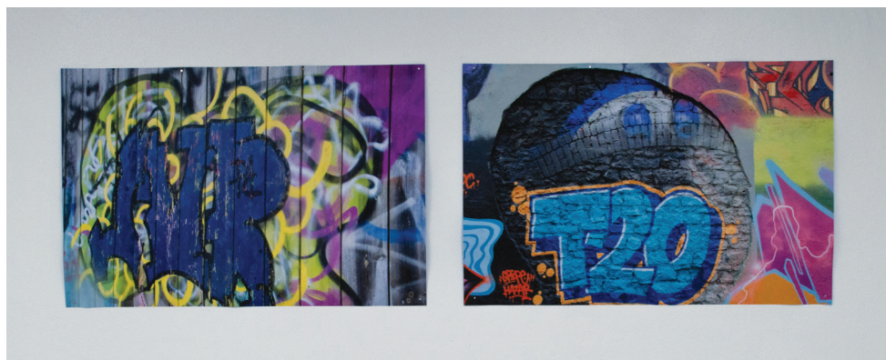
14. Abdelsalam DJEBBAR, série de trois photographies numériques, 65 × 100 cm, 2023