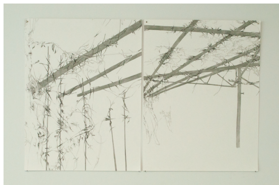
15. Anne-Élisabeth AZRA, Structures ré-habitées , dessins au feutre noir et fusain sur papier, 65 × 100 cm, 2023