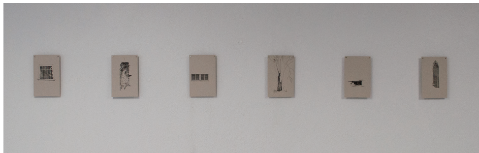
13. Anne-Élisabeth AZRA, Creux et fenêtres , série de dessins au feutre noir sur papier gris, 24 × 15 cm, 2024