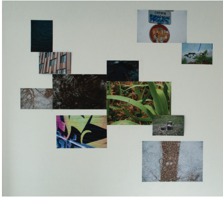
4. Production collective, Mur de photos , photographies numériques, 180 × 210 cm, 2023