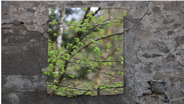
6. Laurine CRATCHLEY, Chimères , vidéo, 2024