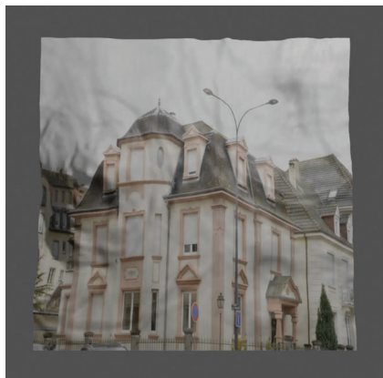
10. Alexis DUPLOUY, Il pleut sur la ville , vidéo modélisation 3D, 2023